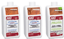
HG V51 HG V52 HG V53