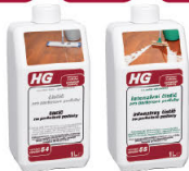
HG V54 HG V55