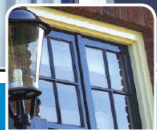
nátery / nátery