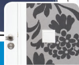
tapety / tapety