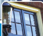
Pintura / Paredes pintadas

Também para paredes pintadas e papel de parede