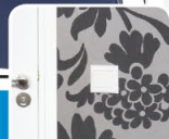
Empapelado / Papel de parede