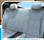
oljusech bilkådel / mugg / tankkainen vehkko