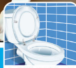
urinen lukt / urinlukt / virtsan hajut

• ei peitää hajua, vaan poistaa sen aiheuttajan • toimii 30 minuutissa