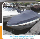
ochranné plachty / ochranné plachty

HG přípravek na čištění slunečníků, markýz, ochranných plachet a stanů