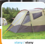
stany / stany