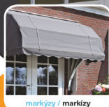
markýzy / markízy

na jednoduché a rychlé osvieženie vzhľadu